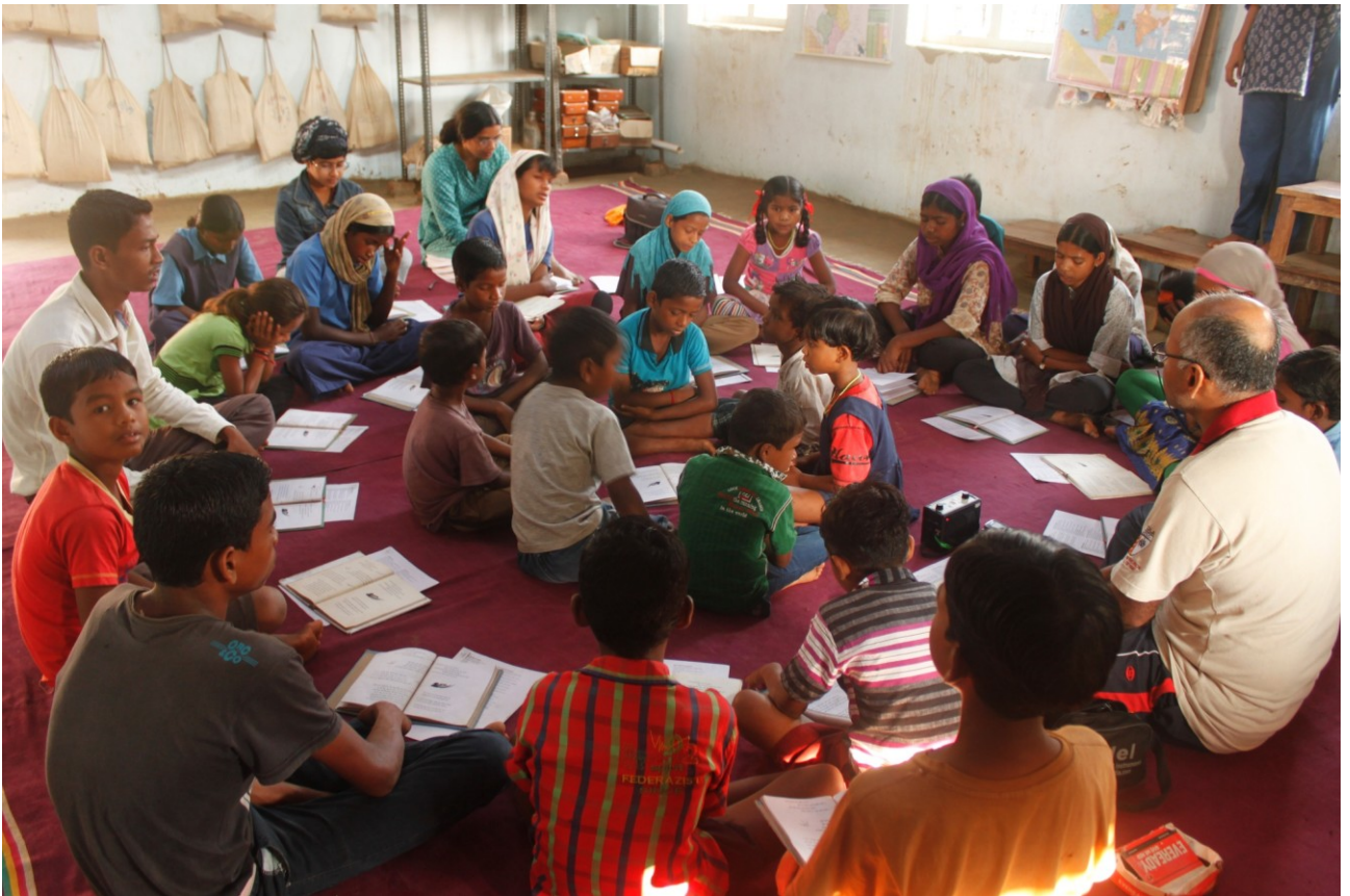
इमली महुआ में गीत-संगीत सत्र

शुक्रवार साप्ताहिक हाट का दिन होता है. उस दिन मिट्टी का काम सीखने वाले बच्चे 11 बजे के करीब मिलन के साथ अपना सामन बेचने बाज़ार जाते हैं. बारी-बारी से उनके साथ कुछ और बच्चे भी बाज़ार जाते हैं. वे हफ्ते भर के लिए राशन और हरी सब्जियां खरीदते हैं. छोटे बच्चे स्कूल में रुककर खेलते हैं या फिर अपूर्ण कार्य को पूरा करते हैं. उस दिन हफ्ते भर का प्लास्टिक आदि कचरा जिसे रीसायकल नहीं किया जा सकता है इकट्ठा कर, स्कूटर पर 13-किलोमीटर दूर कौंडागांव भेज दिया जाता है.